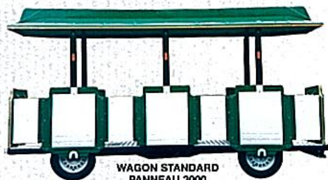
WAGON STANDARD PANNEAU 3000