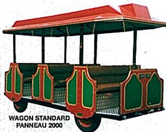
WAGON STANDARD PANNEAU 2000

Dans un souci constant d'amélioration de nos productions, nous nous réservons le droit de modifier, à tout moment, et sans préavis, les caractéristiques et équipements de nos modèles.