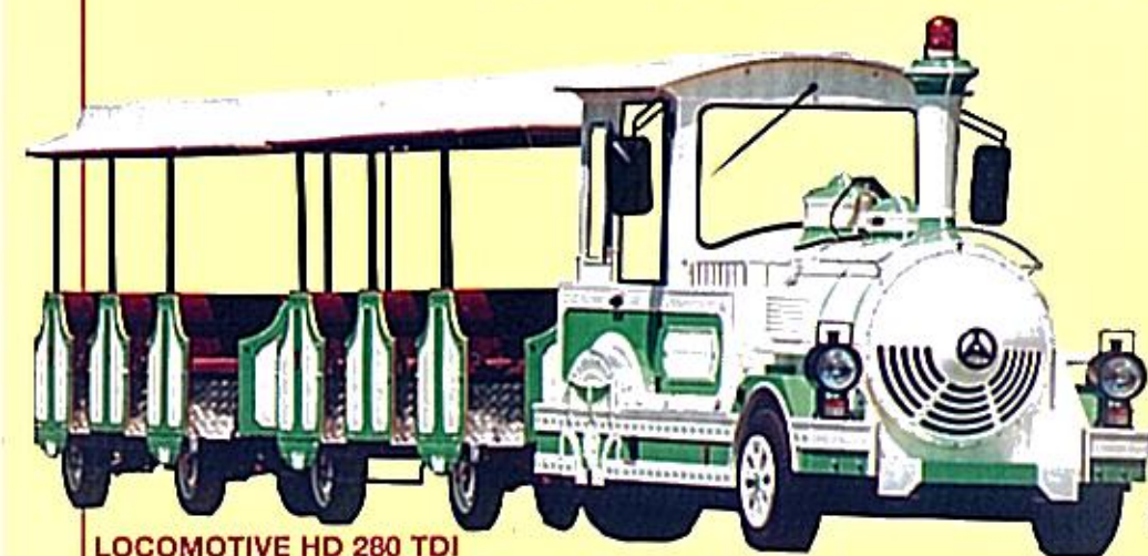
LOCOMOTIVE HD 280 TDI WAGONS STANDARD