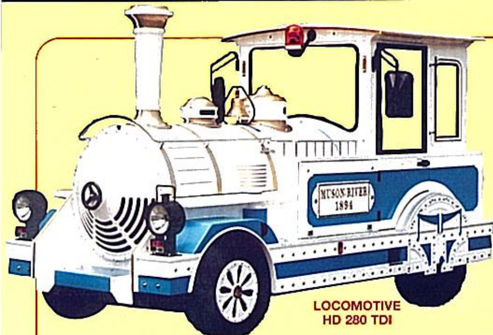
LOCOMOTIVE HD 280 TDI