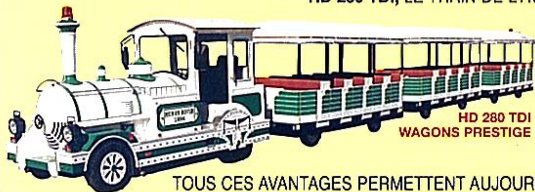
HD 280 TDI WAGONS PRESTIGE

UN TRAIN QUI PREND SOIN DE SON PILOTE, C'EST BIEN. UN TRAIN QUI PREND SOIN DE SES PASSAGERS, C'EST MIEUX. UN TRAIN QUI RESPECTE AUSSI L'ENVIRONNEMENT, C'EST ENCORE MIEUX. HD 280 TDI, LE TRAIN DE L'AVENIR !