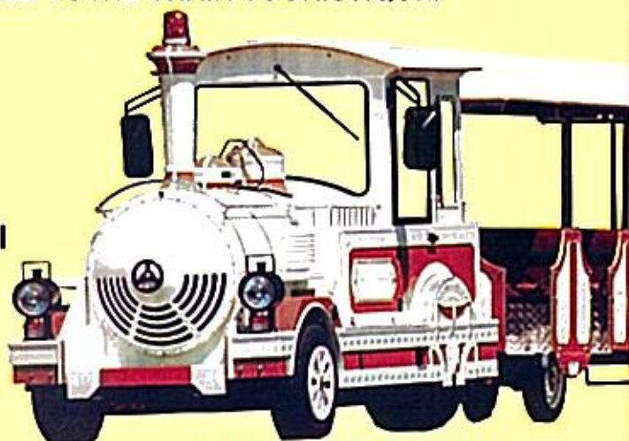
LOCOMOTIVE HD 280 TDI WAGONS STANDARD

LE MODÈLE HD 280 TDI S'IMPOSE COMME LA RÉFÉRENCE DANS LE MONDE DU TRAIN TOURISTIQUE.